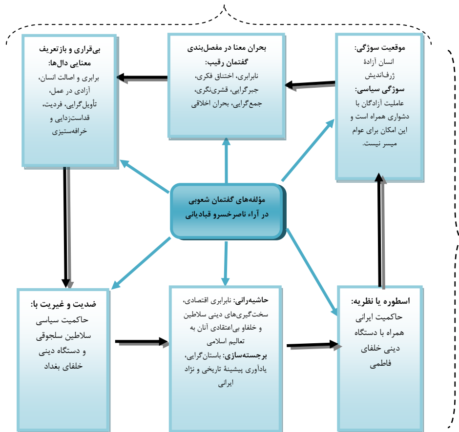
شکل ۲: گفتمان شعوبی در آراء ناصر خسرو قبادیانی